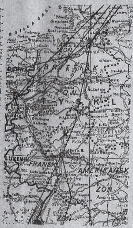
Krysset markerar ungefär den plats, där katastrofen inträffade.

Den föreslagna skattefrittningen har konstruerats som ett nytt allmänt avdrag vid kommunalbeskattningen. Avdragsrätten blir inte beroende av den skattskyldiges förmögenhet. Några beräkningar har nu icke kunnat göras av de föreslagna reglernas inverkan på skatteunderlaget. Även om den till kommunal inkomstskatt taxerade inkomsten skulle minskas icke obetydligt blir dock den verkliga skatteförlusten väsentligt mindre. De